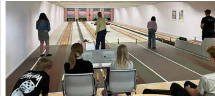
Kegleklubbens har besøg af Tandslet skole.