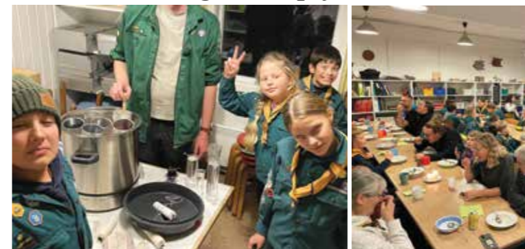
Fuldt hus til juleafslutning